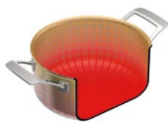
CULINARY FIVEPLY KOCHTOPF