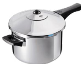
DUROMATIC® INOX STIELMODELL

z. B. Schoppen, Schnuller oder Einmachgläser schnell und unkompliziert sterilisieren.