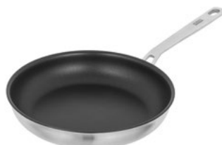
CULINARY FIVEPLY BRATPFANNE BESCHICHTET

Perfekte Wärmeverteilung ohne Angebranntes. Das Must-Have in Ihrer Küche.