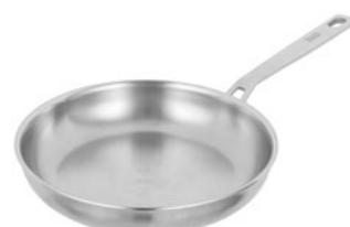
CULINARY FIVEPLY BRATPFANNE UNBESCHICHTET

Ø 20 cm UVP € 69.90 38503 Ø 24 cm UVP € 79.90 38504 Ø 28 cm UVP € 89.90 38505