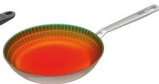
CULINARY FIVEPLY BRATPFANNE