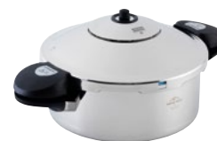
DUROMATIC® INOX FORMA SEITENGRIFFMODELL

Ø 20 cm / 3.5 L UVP € 219.00 € 169.00 3050 Ø 22 cm / 5.0 L UVP € 239.00 € 179.00 3342