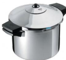
DUROMATIC® INOX SEITENGRIFFMODELL

Ø 20 cm / 3.5 L UVP € 219.00 € 169.00 30373