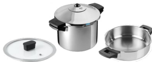
DUROMATIC® INOX SET 4-TEILIG

Ø 22 cm / 4.0 L UVP € 239.00 € 179.00 3042 Ø 24 cm / 6.0 L UVP € 269.00 € 199.00 3017 Ø 24 cm / 8.0 L UVP € 289.00 € 219.00 3018